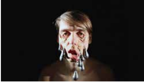
Sad Skin | 2014 | Videostill | © VG Bild-Kunst Bonn 2020

Es ist die erste große Einzelausstellung des in Mainz lebenden Künstlers Markus Walenzyk (Jg. 1976), die einen umfassenden Einblick in das facettenreiche Werk gibt. Walenzyks performative Videos bestechen durch einfache Settings, die anfangs meist ganz harmlos daher kommen, jedoch im Verlauf eine dramatische