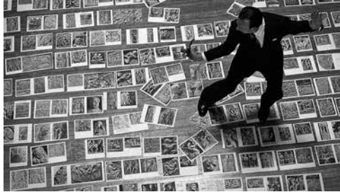
Dennis Adams | Malraux's Shoes | 2012

Die zweite Biennale für aktuelle Fotografie untersucht unter dem Titel The Lives and Loves of Images , wie die Fotografie zum Symbol für die Extreme unserer Gesellschaft wurde. Kurator David Company widmet sich in seinem Konzept den widersprüchlichen Gefühlen, die Fotografie in uns auslösen kann –