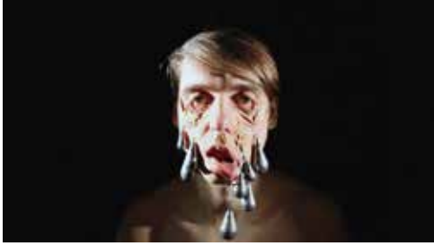
Sad Skin | 2014 | Videostill

Es ist die erste große Einzelausstellung des in Mainz lebenden Künstlers Markus Walenzyk (Jg. 1976), die einen umfassenden Einblick in das facettenreiche Werk gibt. Walenzyks performative Videos bestechen durch einfache Settings, die anfangs meist ganz harmlos daher kommen, jedoch im Verlauf eine dramatische