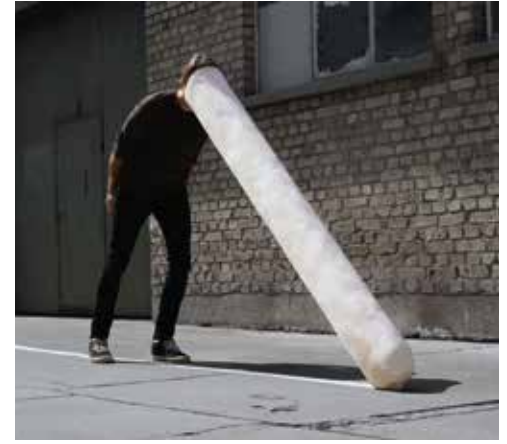
Überdehntes Portrait | 2019 | © VG Bild-Kunst Bonn 2020

Markus Walenzyk beschäftigt der Mensch – sein Selbstbildnis, sein Porträt, als innere Vorstellung, als Idee und Experiment: Bilder, Formen, Fratzen, Masken, welche den Körper verändern, verwandeln, entstellen oder sich von ihm lösen, unabhängig werden, sich auf und durch ein neues Medium übertragen. Es entstehen künstliche Gestalten, Imitationen, rätselhafte Objekte, Appropriationen, Metamorphosen, Archetypen, die Körper und Gesicht überformen, deren Platz einnehmen und so zum Ausdruck von Erfahrung, Erinnerung und Identität werden.