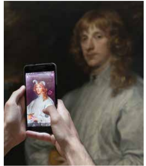
Antonio Pérez Río | Portrait of James Stuart | aus der Serie Masterpieces | 2017

Weitere Informationen zur Biennale gibt es auf www.biennalefotografie.de .