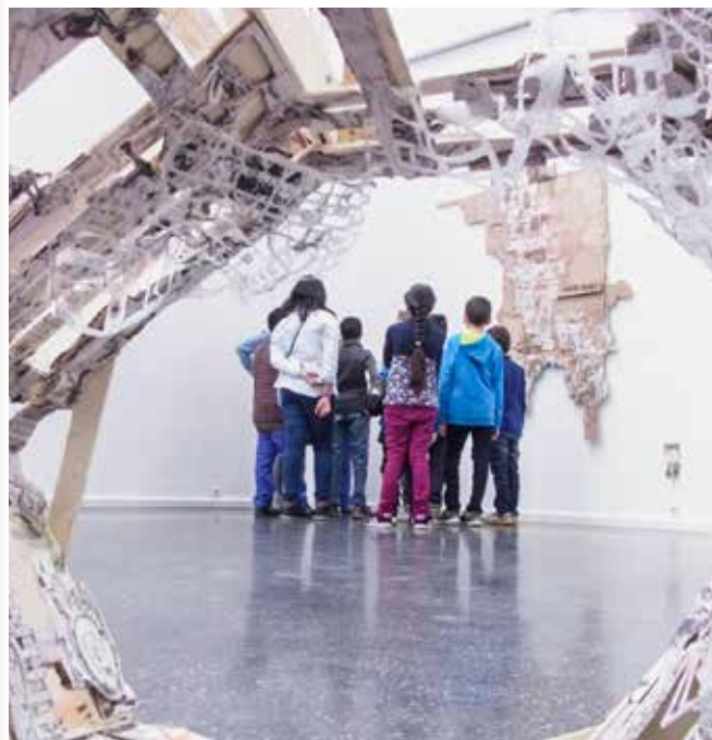
Führungen – Kinder führen Kinder

Kinder ab 6 Jahren können in einer Gruppe von 10 bis max. 12 Teilnehmern ihren Kindergeburtstag am Samstag oder Sonntag im Kunstverein feiern. Wir bitten um eine frühzeitige Anmeldung (mind. 3 Wochen im Voraus) unter 0621 52 80 55 oder schubert@kunstverein-ludwigshafen.de